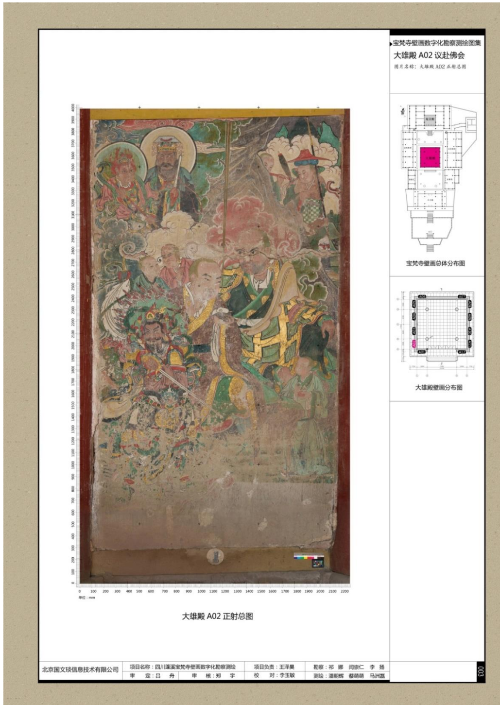
图 C.1 壁画泛光正射影像图总图示例