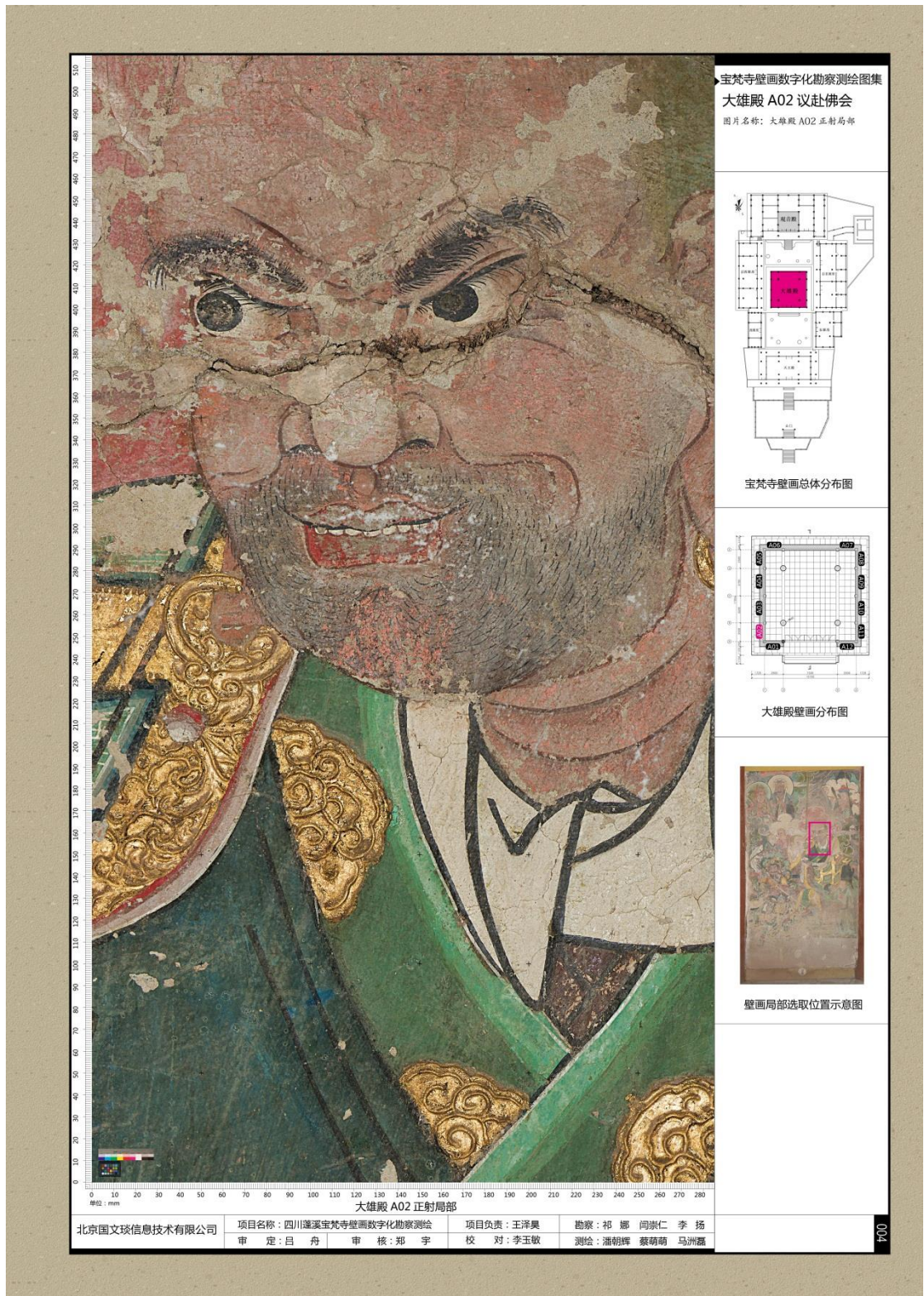
图 C.2 壁画泛光正射影像图局部放大图示例