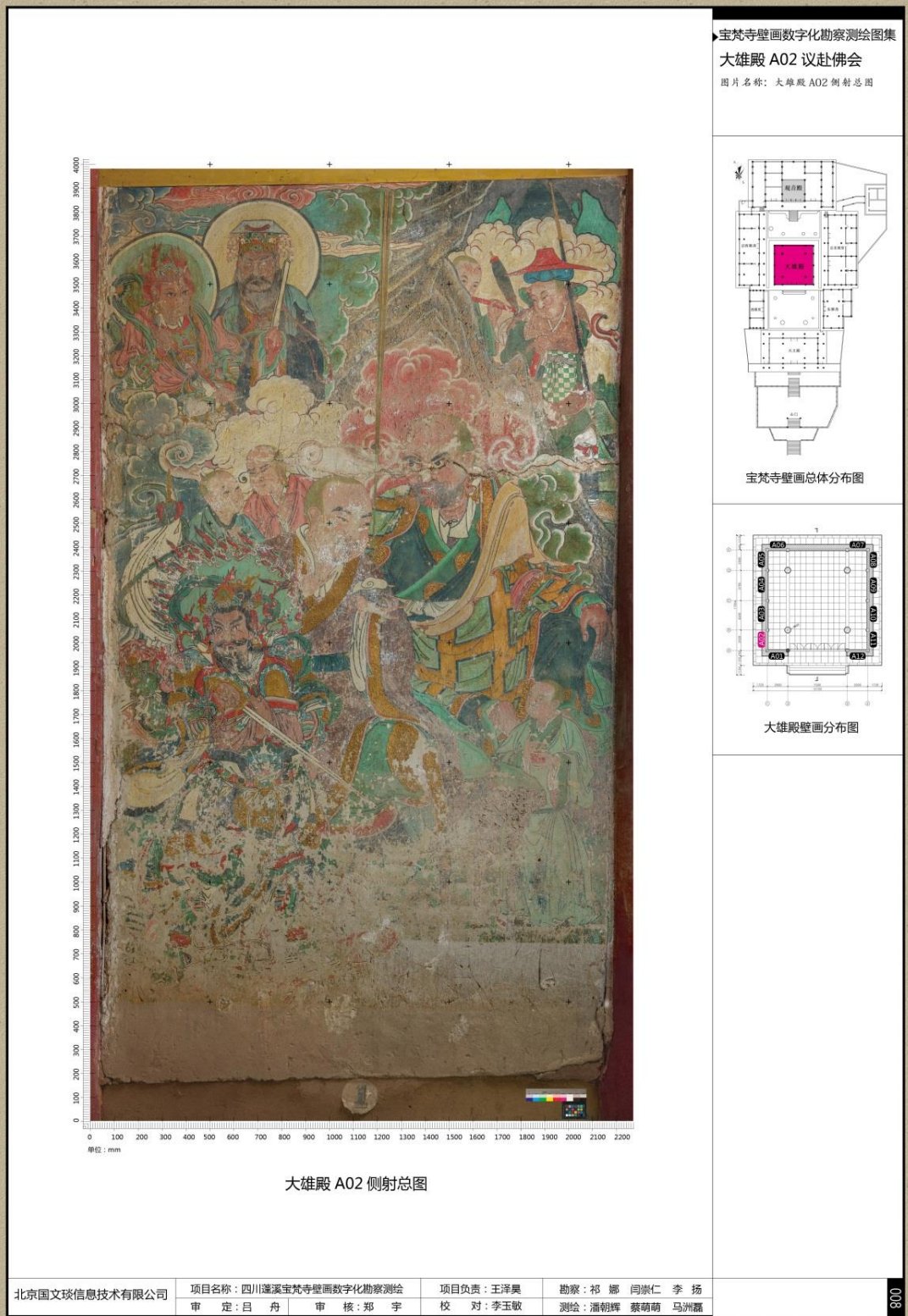
图 C.3 壁画侧光正射影像图总图示例